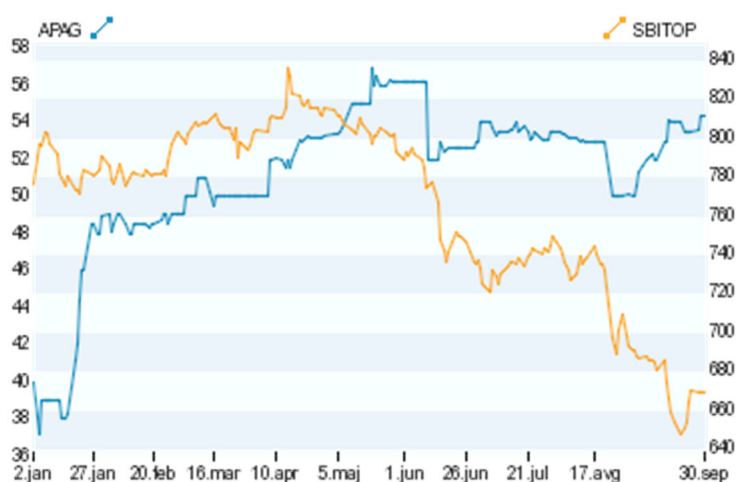
Slika 1: Gibanje tečaja delnice APAG in borznega indeksa SBITOP v obdobju januar – september 2015