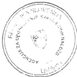
Agencija za upravljanje kapitalskih naložb RS, ki jo zastopa Igo Gruden v.d. predsednika uprave

Upravo družbe pozivamo, da skliče skupščino takoj.