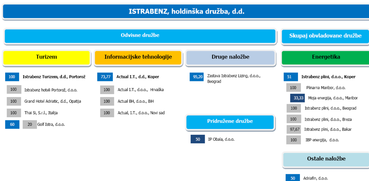
Slika 1: Organigram Skupine Istrabenz na dan 30. 6. 2014