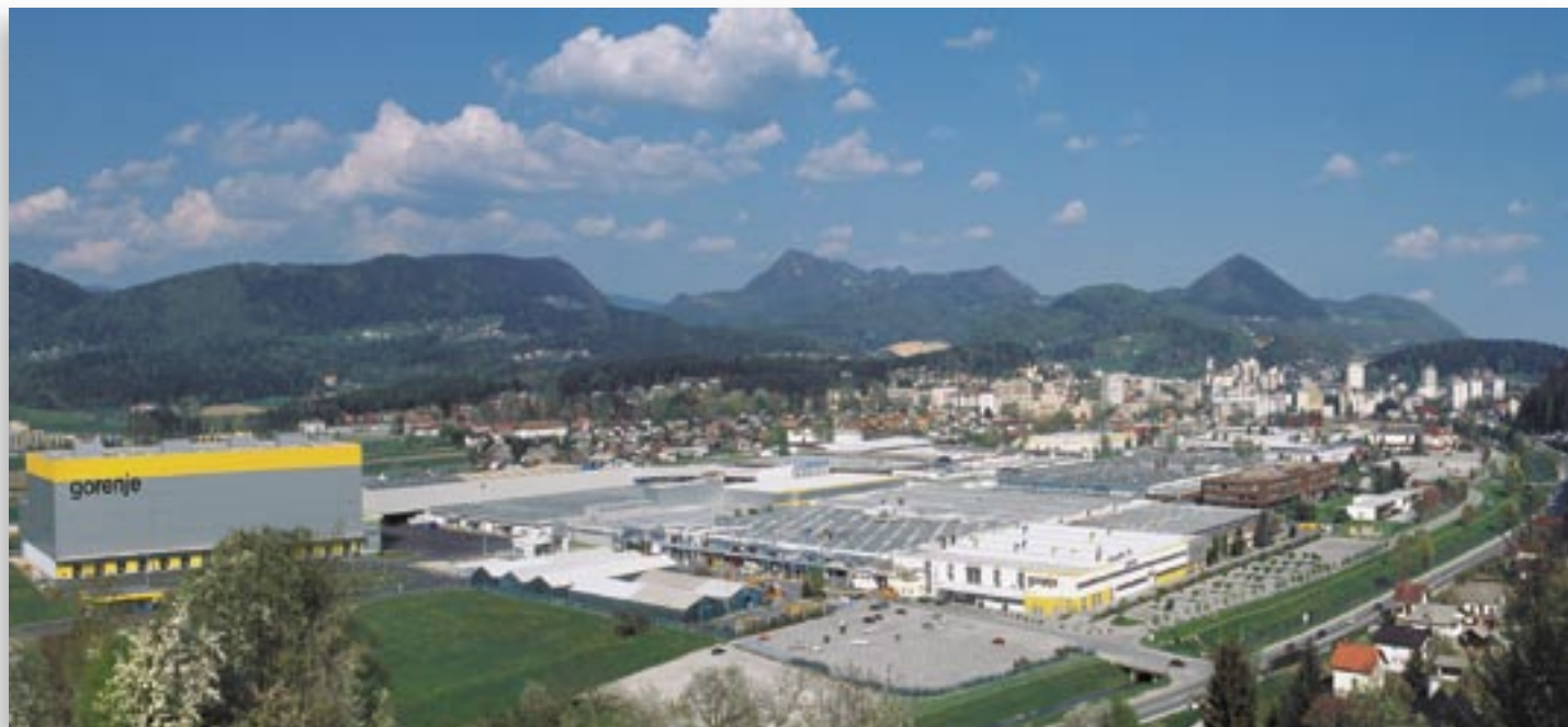
GORENJE PLANT IN VELENJE, SLOVENIA.tif