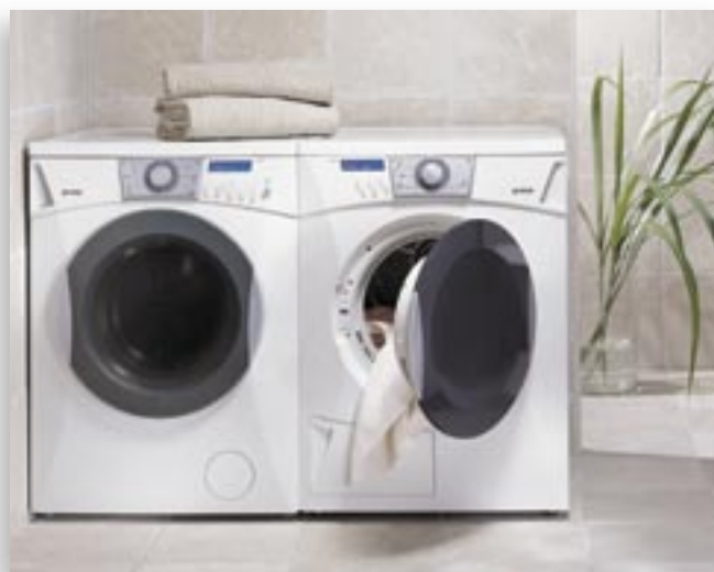
WASHING & DRYING COUPLE.tif