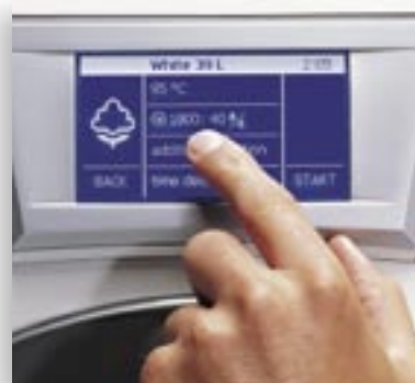
TOUCH CONTROL SCREEN.tif