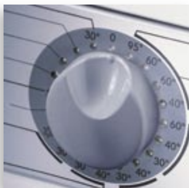
CONTROL PANEL - BUTTON.tif