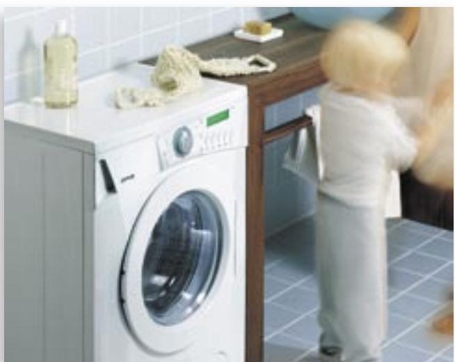
44 cm SLIM WM.tif