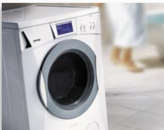
WM - PREMIUM TOUCH.tif