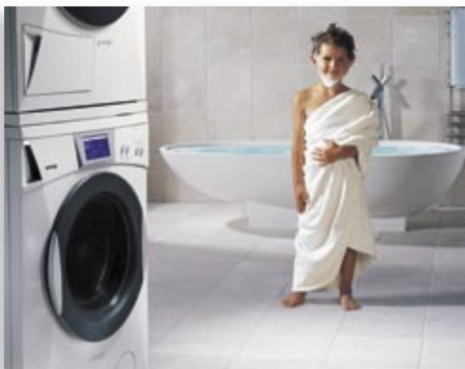
PREMIUM TOUCH TOWER- COMBINATION.tif