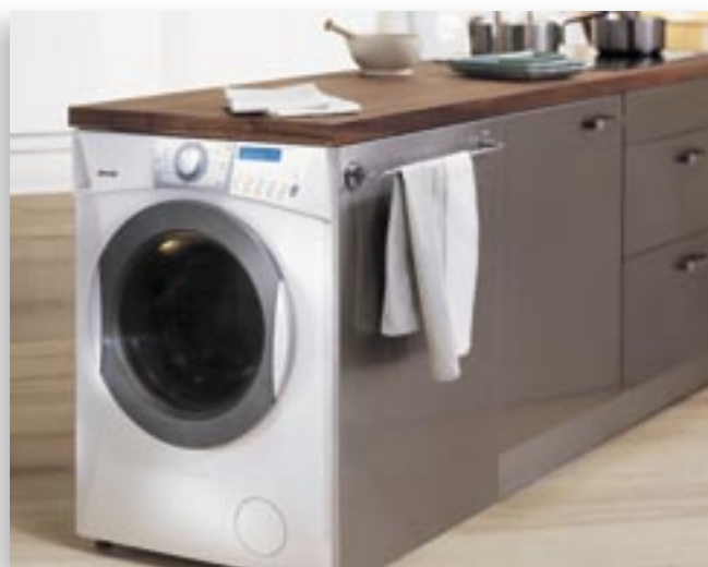
UNDERCOUNTER WASHING MACHINE.tif